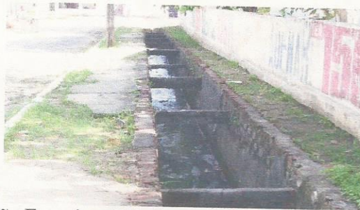
fotos da 2ª Travessa João Francisco Ribeiro

Da decisão dê-se ciência aos moradores da referida comunidade.