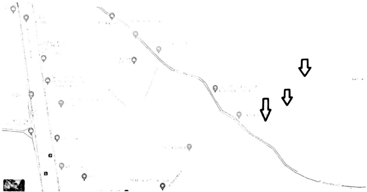
Imagem da Localização da Rua que receberá nomeação no Mapa